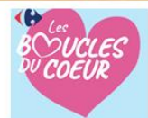
Draguignan dans le cadre des 2017.